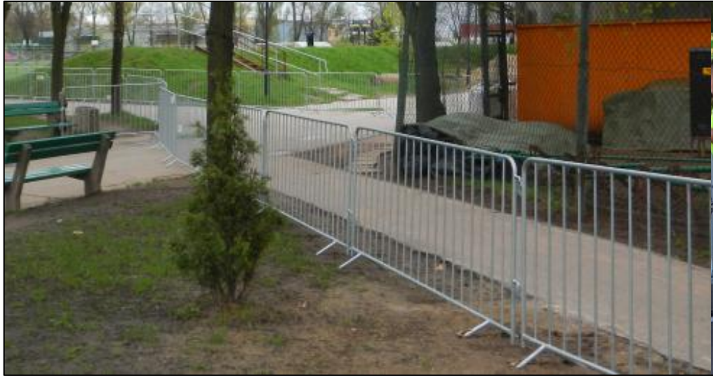
Przykładowe wygrozdzenie dojścia z szatni do płyty boiska