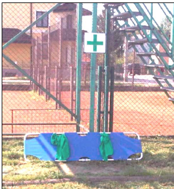
Przykładowe nosze usztywnione oraz oznakowanie punktu noszowych