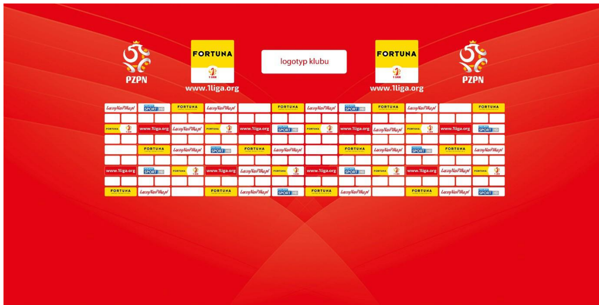
Poglądowa ścianka do sal konferencyjnych na meczach o Mistrzostwo 1. ligi