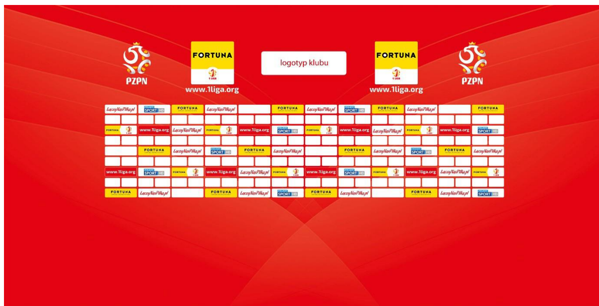
Poglądowa ścianka do sal konferencyjnych na meczach o Mistrzostwo 1. ligi