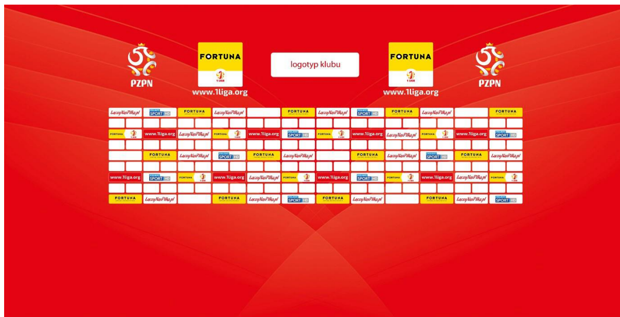
Poglądowa ścianka do sal konferencyjnych na meczach o Mistrzostwo 1. ligi