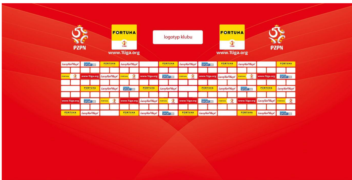
Poglądowa ścianka do sal konferencyjnych na meczach o Mistrzostwo I ligi