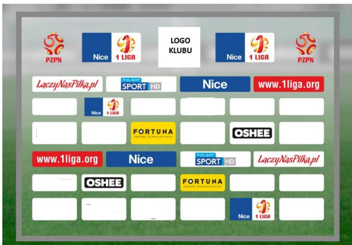
Poglądowa ścianka do sal konferencyjnych na meczach o Mistrzostwo I ligi