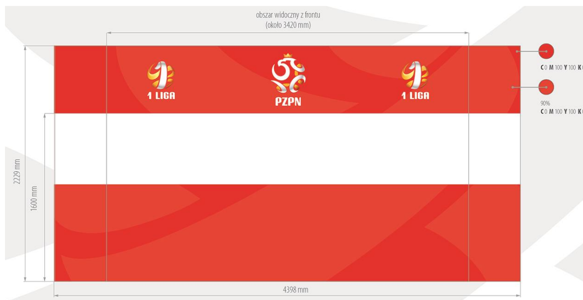
Poglądowa ścianka do sal konferencyjnych na meczach o Mistrzostwo I ligi